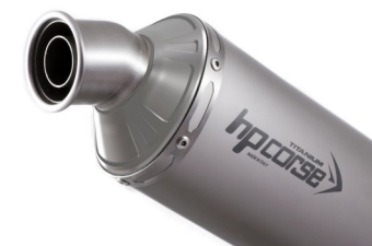
> PARTICOLARE DEL FONDELLO