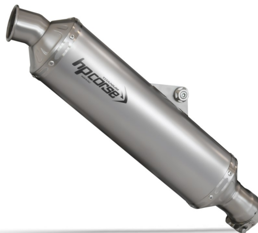
> TERMINALE OMOLOGATO SLIP-ON