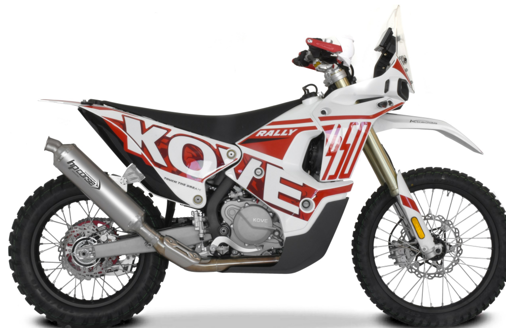
> CONFIGURAZIONE OMOLOGATA EURO 5