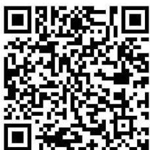
KOVE 450 RALLY