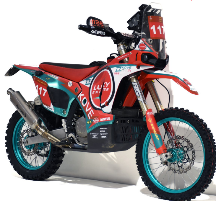
➤ KOVE 450 TEAM KOVE ITALIA DAKAR 2025