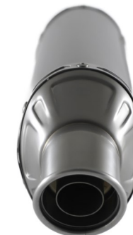
➤ TERMINALE OMOLOGATO SLIP-ON