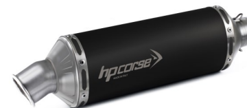
SP-1 EVOLUZIONE ACCIAIO NERO PASSAGGIO BASSO COD.KO80XSP1ELC-A