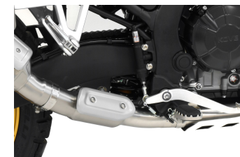
RACCORDO PASSAGGIO BASSO COD. KO80X-L