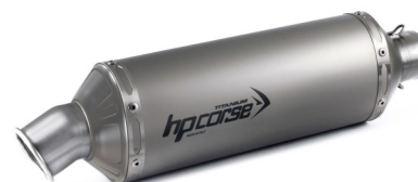
SP-1 EVOLUZIONE TITANIO PASSAGGIO BASSO COD.KO80XSP1ELT-A