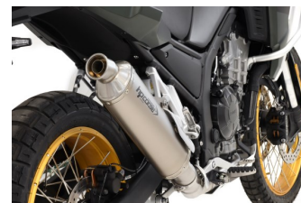
SP-1 350 EVOLUZIONE TITANIO PASSAGGIO BASSO