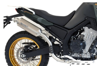
SP-1 350 EVOLUZIONE TITANIO PASSAGGIO ALTO