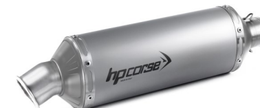
SP-1 EVOLUZIONE ACCIAIO SATINATO PASSAGGIO BASSO COD.KO80XSP1ELS-A