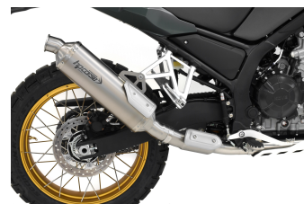
SP-1 350 EVOLUZIONE TITANIO PASSAGGIO BASSO