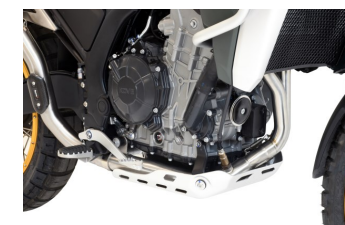
COLLETTORE PRIMARIO 2 IN 1 COD. KO80X-21