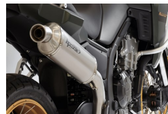
SP-1 350 EVOLUZIONE TITANIO PASSAGGIO ALTO