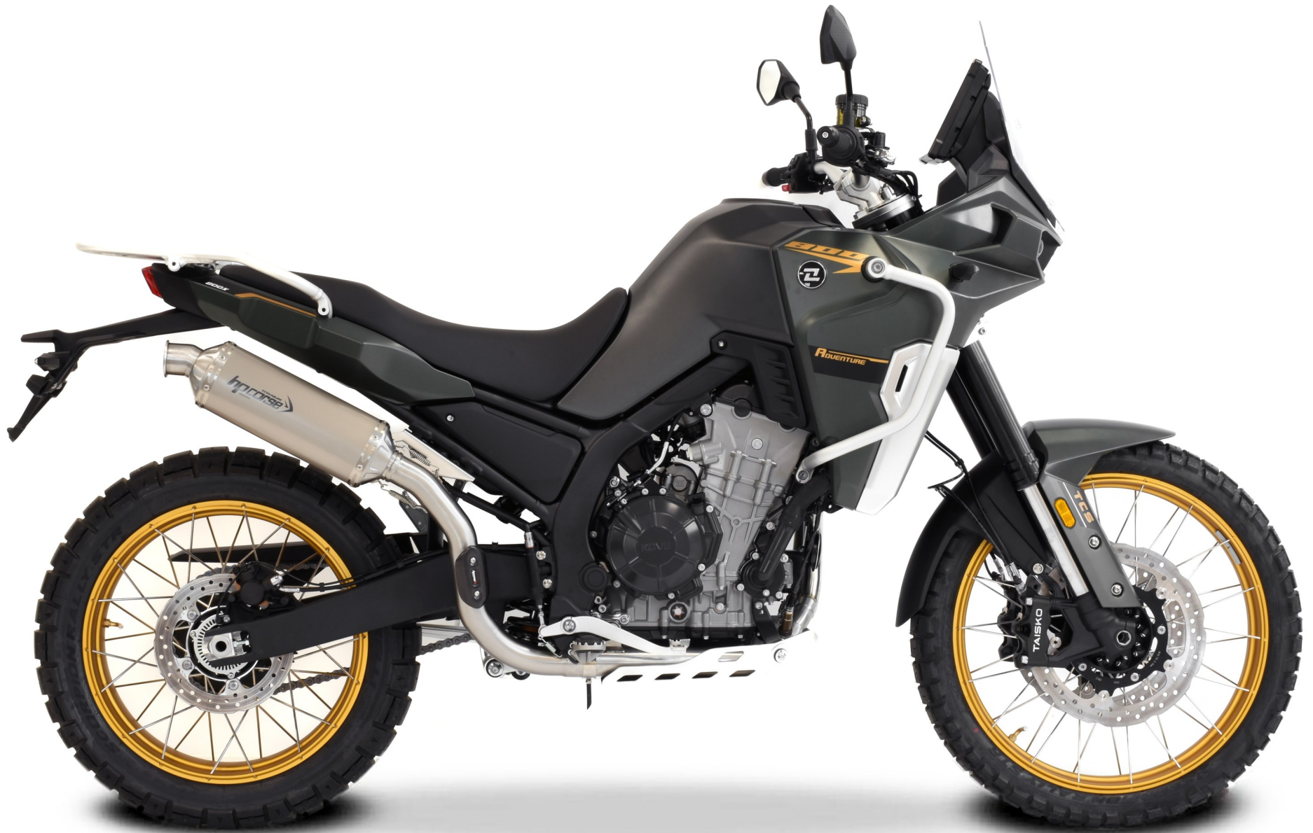
SP-1 PASSAGGIO ALTO