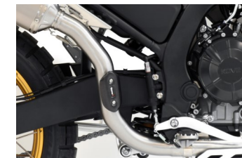
RACCORDO PASSAGGIO ALTO COD. KO80X-H