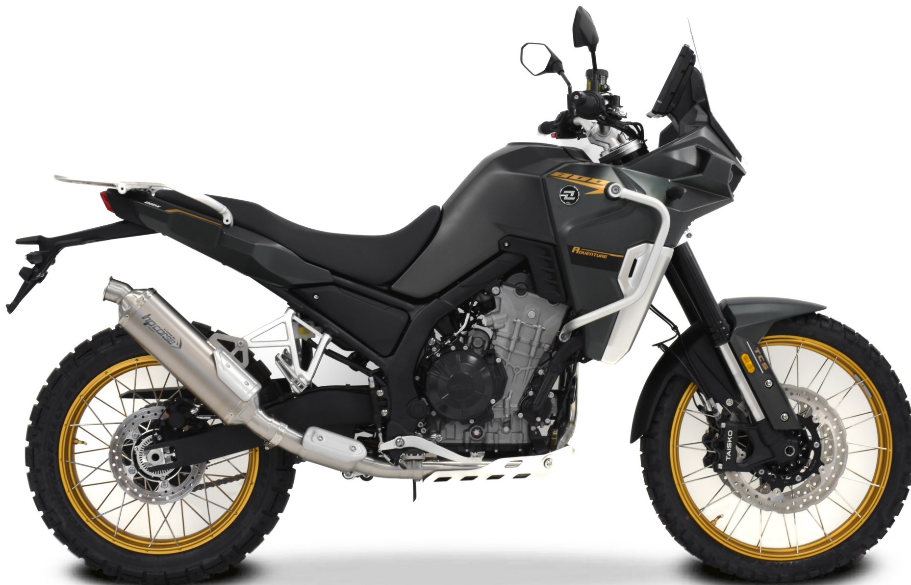
SP-1 PASSAGGIO BASSO